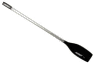
Paddel oder Ruder – nur für Fahrzeuge die durch Paddel oder Ruder bewegt werden können