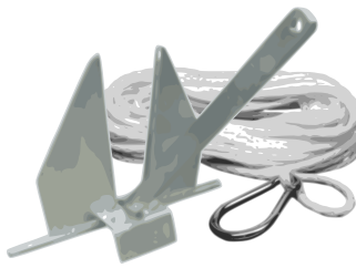
Ankergeschirr – ausgenommen Ruderboote – sowie Segelboote ohne festen Ballast bis 4,4 kW Maschinenleistung