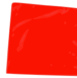
rote Notsignalflagge – Mindestgröße 60 cm x 60 cm