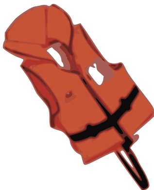
Rettungsweste – für jede Person an Bord – Mindestauftrieb 100 N – für Kinder unter 12 Jahren nur Rettungswesten mit Kragen oder Rettungskragen – auf Segelfahrzeugen nur Rettungswesten und –Kragen