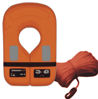
Rettungsring oder –Kragen – Mindestauftrieb 100 N – mit schwimmfähiger Wurfleine, Mindestlänge 10 – für Fahrzeuge > 30 kW und Segelschiffe mit festem Ballast