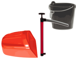
Lenzeinrichtung – mechanisch